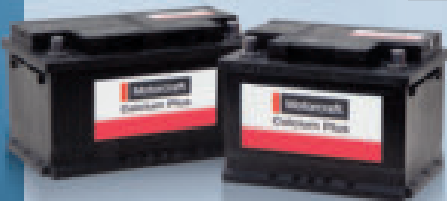
Abbildung nur Musterbeispiel