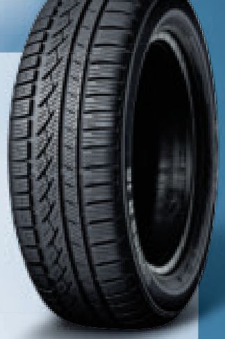
Abbildung nur Musterbeispiel

Der Reifenpreis versteht sich pro Stück, ohne Rad, Wuchten, Montage und Radabdeckung. Kraftstoffeffizienz: KE, Nasshaftung: NH, Geräuschklasse und Abrollgeräusch in dB: DB, laut EU-Verordnung 1222/2009.