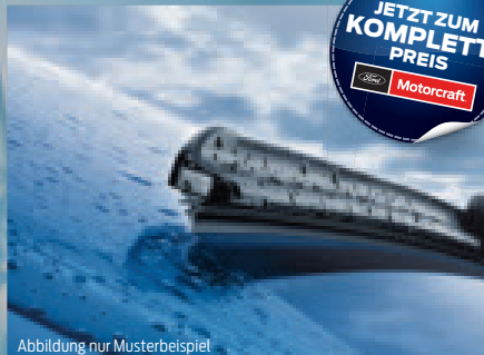
Abbildung nur Musterbeispiel