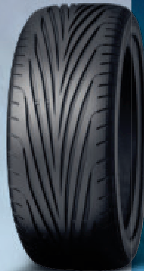
Abbildung nur Musterbeispiel